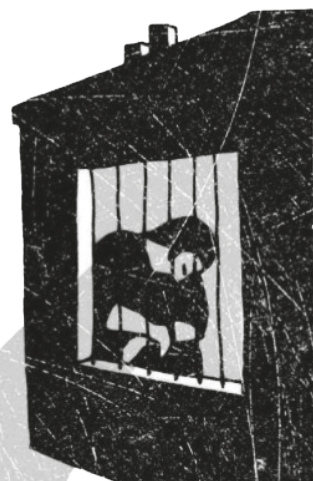
Desenho: Evelyn e Mary

Isaiás 55, 6-9 . Salmo 144 (145) . Filipenses 1, 20c-24.27a . Mateus 20, 1-16a