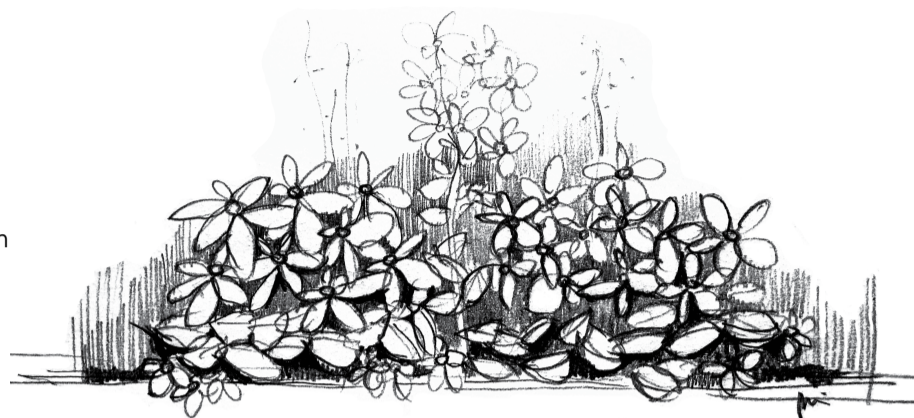
ILUSTRAÇÃO DA ARQ. MARIA TAVARES

CONCRETIZAÇÃO: Diante do altar pode surgir um arranjo floral bem visível, no qual predomine o verde e o branco.