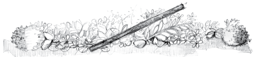
ILUSTRAÇÃO DA ARQ. MARIA TAVARES

CONCRETIZAÇÃO: Celebrar a fé, em dia do Senhor e em comunidade, nunca é acto local isolado. Sempre que nos reunimos, somos povo de Deus peregrino, aberto à experiência do encontro com o Mestre e Pastor, mas em comunhão com toda a Igreja e na esperança de que todos desejem ir ao seu encontro e descubram o seu rosto salvador. Para significar esse dinamismo, propomos que se faça um arranjo floral, disposto na horizontal, onde abundem os verdes. Acrescentar um bastão.